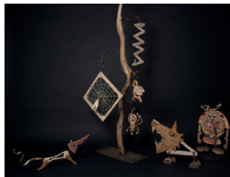
C'est quand ?