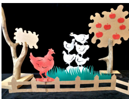
Le bout du monde