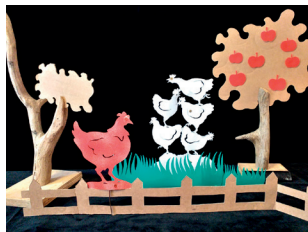
Fermez-bien la porte