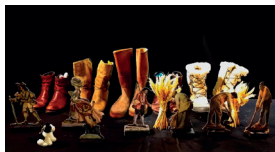
Perrault et le chemin des ogres